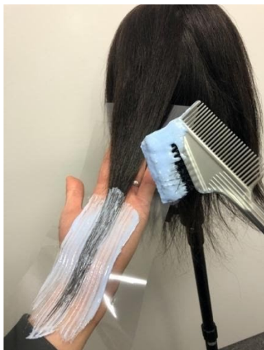
写真②「使用例」～透明なので染色の変化が一目で分かります。