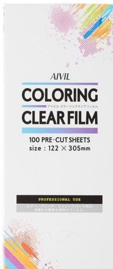
写真①「アイビル カラーリングクリアフィルム」

「アイビル カラーリングクリアフィルム」は、透明なので塗り残しなく裏側までしっかり塗れているか確認できます。透明なので、ブリーチやカラーの変化がひと目見て分かる所もポイントの一つです。折り畳まないで、カラーホイールよりもスピーディーな技術が可能になっております。